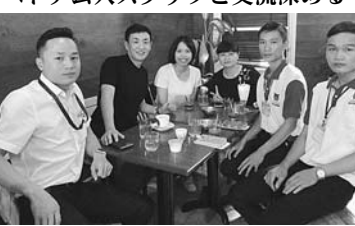
オカフーズとクアアビビュー・フーズ(ベトナム)は、お互いを重要なパートナーと位置付け、スタッフ同士の交流を深めている。(関連記事4面)

東北復興商談会特集...6 ☆IFA(国際食品流通同友会)特集...3 ☆オカフーズ特集...4 ☆トナー会会長にキユーピー長南氏...5